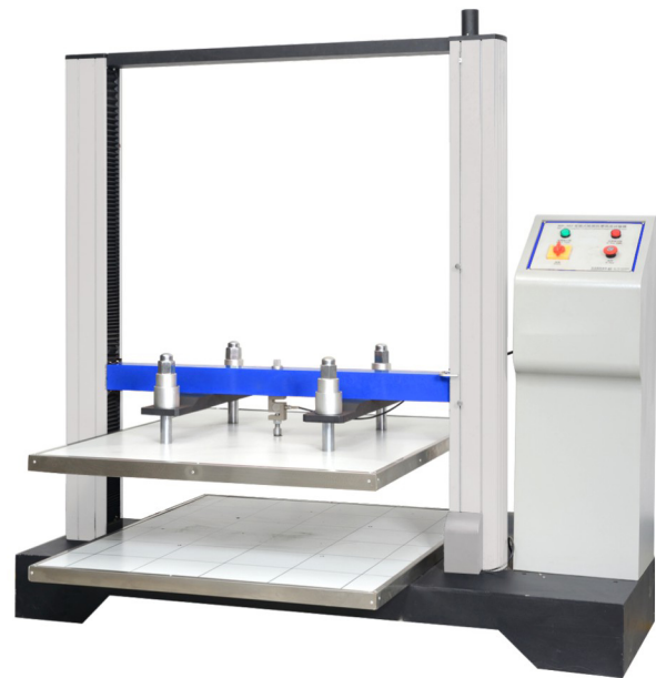
HD-A502S(单个传感器) Single sensor

Computer servo control carton compressive tester series